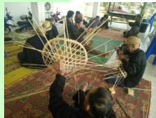
กลุ่มผู้สูงอายุ ร่วมกันจักสาน "อบ"

คำว่า "จัก" คือ การทำให้เป็นแฉก เป็นหยัก ๆ ด้วยฟันเลื่อยหรืออีกวิธีการหนึ่ง การที่ชาวบ้านใช้คมมีดผ่าไม้ไผ่แล้วทำให้เป็นเส้นบาง ๆ วิธีการอย่างนี้ก็เรียกว่าจัก เช่นกัน ส่วนไม้ไผ่ หรือ หวาย ที่จักออกมาเป็นเส้นบาง ๆ นั้นเรียกว่า ดอก ถึงตอนที่การที่ชาวบ้านนำดอกมาขัดกันจนเกิดลวดลายที่ต้องการ เราเรียกว่า สาน ค่ะ จากนั้นแล้วก็จะเป็นการสร้างสรรค์ให้เกิดรูปทรงต่าง ๆ จนท้ายที่สุดเป็นภาชนะสามารถนำไปใช้สอยได้ตามต้องการ