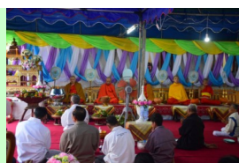
ทำพิธีทางศาสนา