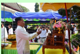
ทำนบนำดอกไม้บูชาพระรัตนไตร