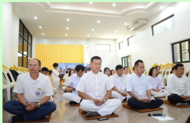
โครงการอบรมคุณธรรม จริยธรรม ประจำปีงบประมาณ 2560

ได้มีการจัดอบรมคุณธรรม จริยธรรม คณะผู้บริหาร สมาชิกสภาฯ และพนักงานองค์การบริหารส่วนตำบล ปากอคำ เพื่อพัฒนาจิตและปลูกฝัง จริยธรรม คุณธรรม และศีลธรรม ตาม หลักพุทธศาสนา เพื่อฝึกจิตให้มีสติรู้เท่า ทันอารมณ์ รู้จักควบคุมอารมณ์ของ ตนเองและแสดงออกทางด้านอารมณ์ ได้อย่างเหมาะสม ทำให้สามารถ ปรับตัวรับความเปลี่ยนแปลงอย่าง