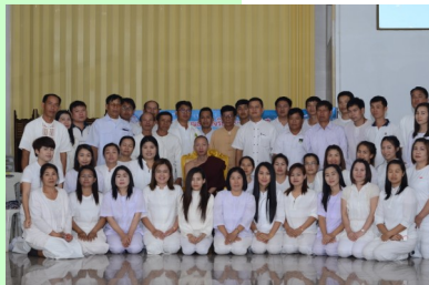
โครงการอบรมคุณธรรม จริยธรรม ประจำปีงบประมาณ 2560

รวดเร็วได้ การเรียนรู้และเข้าใจ หน้าที่พุทธบริษัทให้เยาวชนเข้าใจ อย่างถูกต้อง ส่งเสริมจิตสำนึกใน ความรักชาติ ศาสนาและ พระมหากษัตริย์