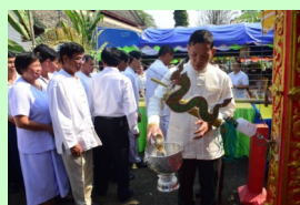
ทำนบนำดอกไม้บูชาพระธาตุดันมหายางคกเจดีย์