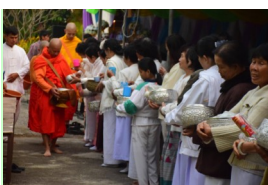
คณะกรรมาธิการวัดโป่งมอญทำบุญกับพระในช่วงเช้า