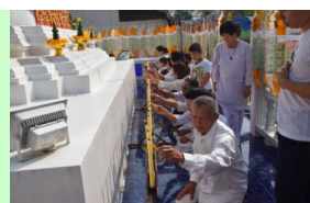
คณะกรรมาธิการก่อนบูชาพระธาตุดันมหายางคกเจดีย์